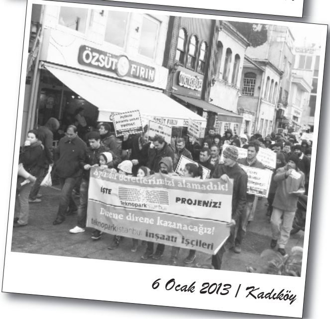
6 Ocak 2013 | Kadıköy