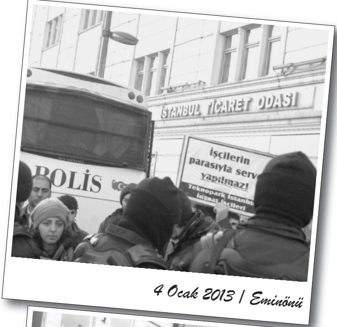
4 Ocak 2013 | Eminönü